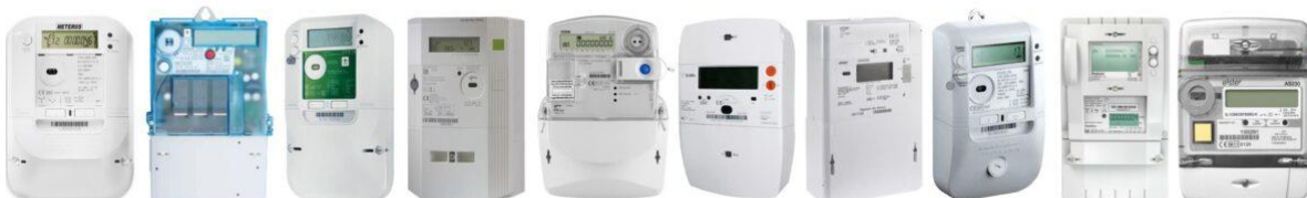
Divers compteurs intelligents de différents fabricants

Le compteur intelligent envoie les données à un centre de contrôle ou à quelqu'un qui lit les données à distance. Personne ne vient dans la maison pour lire le compteur. Il existe de nombreux fabricants de compteurs intelligents :